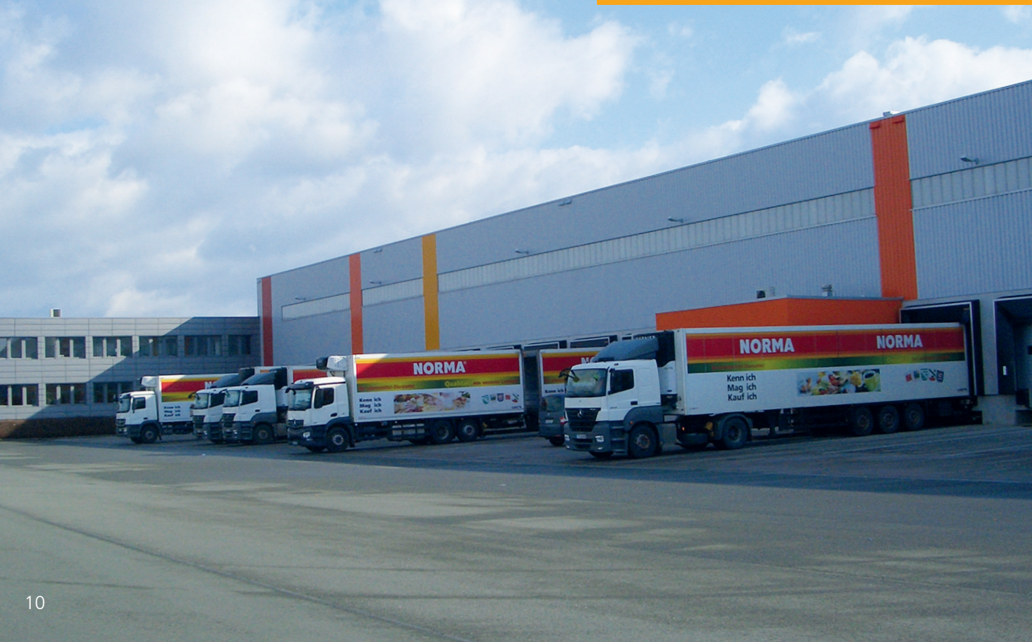
LOGISTIKZENTRUM MITTELDEUTSCHLAND IN ERFURT