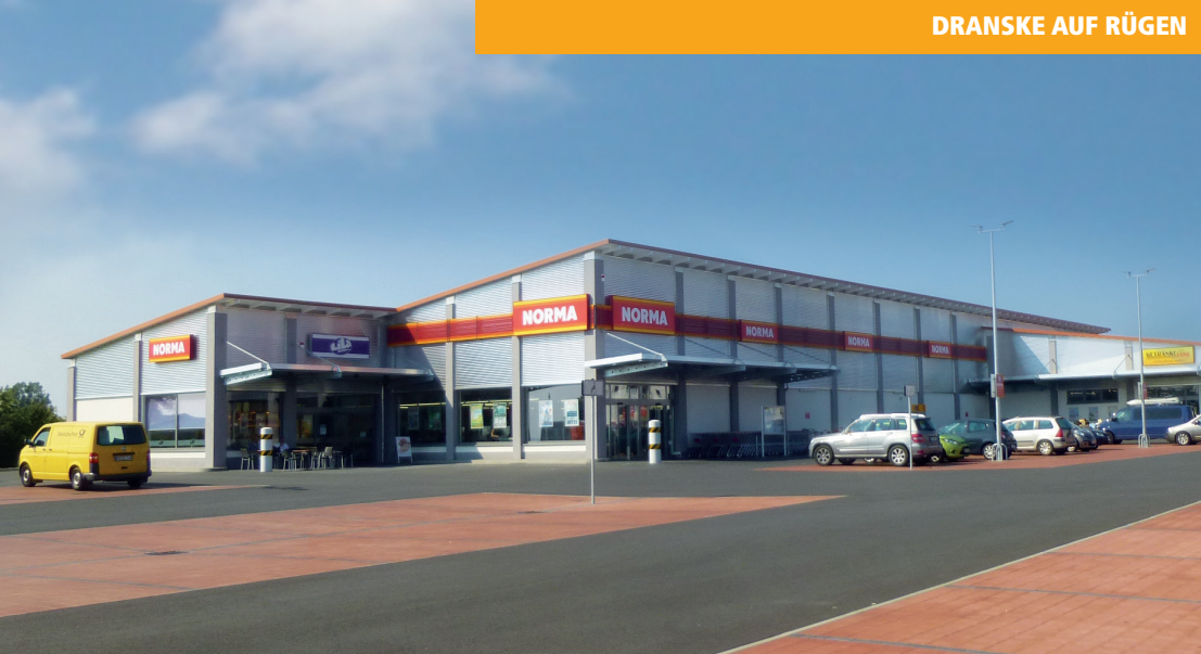
DRANSKE AUF RÜGEN